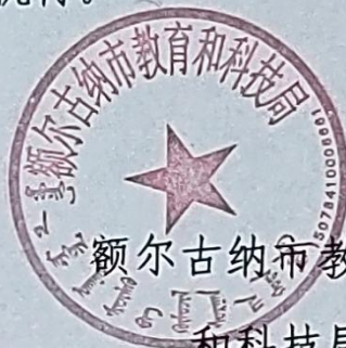
额尔古纳市教育和 科技局