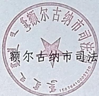
额尔古纳市司法局