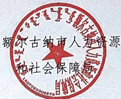
额尔古纳市人力资源 和社会保障局