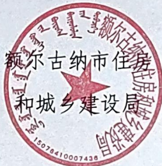
额尔古纳市住房 和城乡建设局