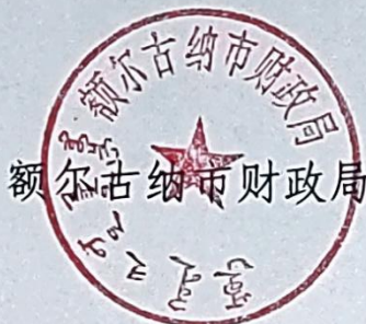
额尔古纳市财政局