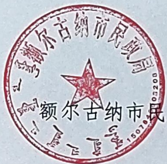
额尔古纳市民政局

为规范全市低保边缘家庭、刚性支出困难家庭认定工作，健全低收入人口认定、动态监测和常态化救助帮扶机制，额尔古纳市民政局等单位制定了《额尔古纳市低保边缘家庭审核确认实施细则》和《额尔古纳市刚性支出困难家庭审核确认实施细则》，现印发给你们，请结合实际贯彻执行。